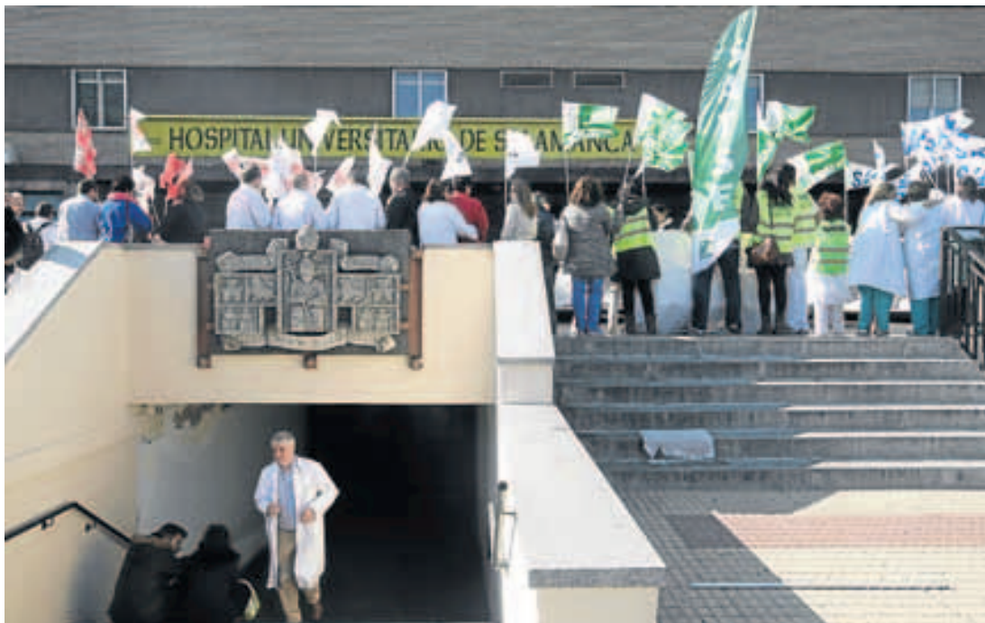
Protestas del colectivo de atención sanitaria a las puertas del Clínico.

Los sindicatos consideran que detrás de esta ausencia de personal está la intención oculta de defenestrar el nivel del Hospital de Salamanca para reducir su nivel. Por el momen-