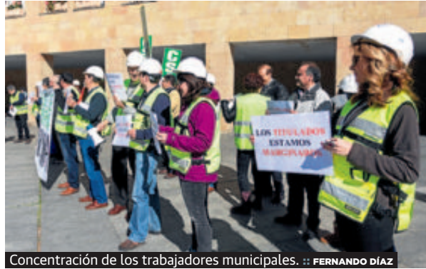
Concentración de los trabajadores municipales.

:: La CSIF exigió ayer en su concentración de los miércoles una reunión «urgente» con la alcaldesa de Logro-