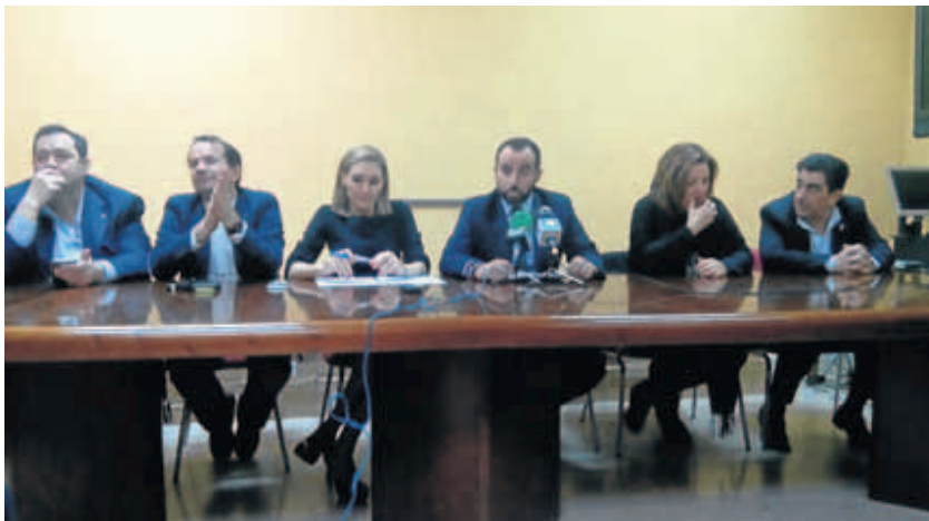
Comparecencia de Empresarios de Salamanca ayer en la sede de la asociación de Hostelería.