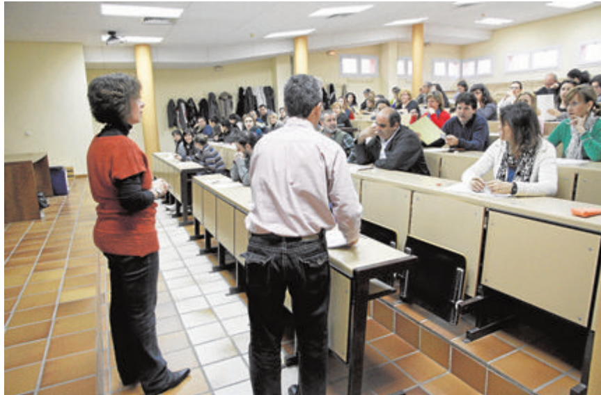
Aspirantes a un puesto laboral de la Junta en los últimos exámenes celebrados.