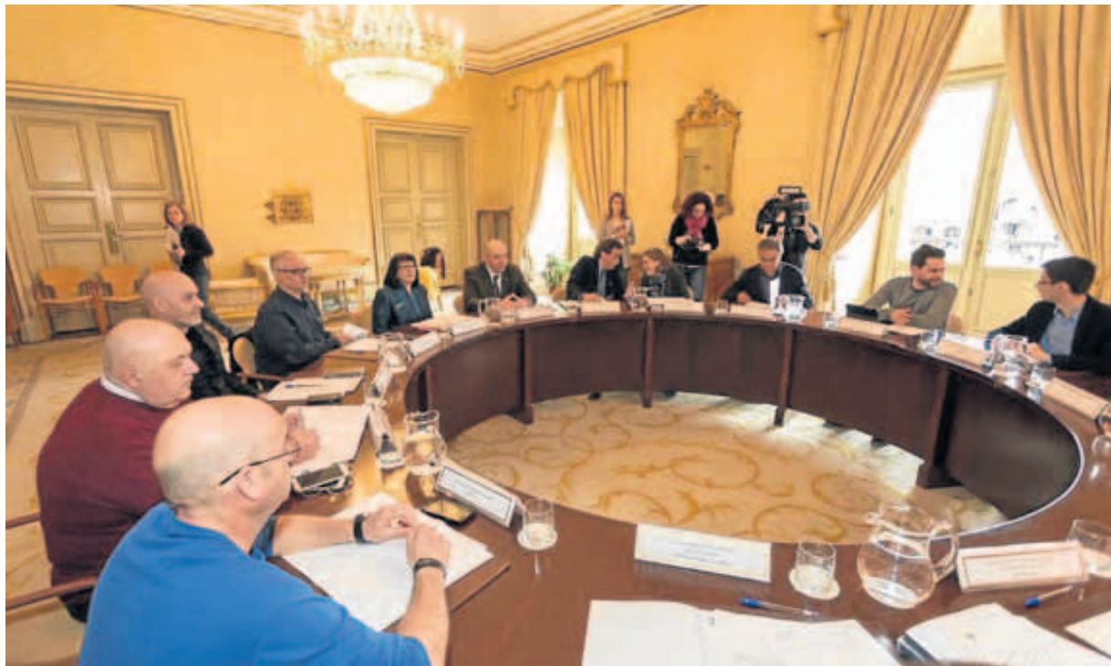
Un momento de la reunión que celebró en la tarde de ayer el Consejo de Ciudad en el Ayuntamiento.